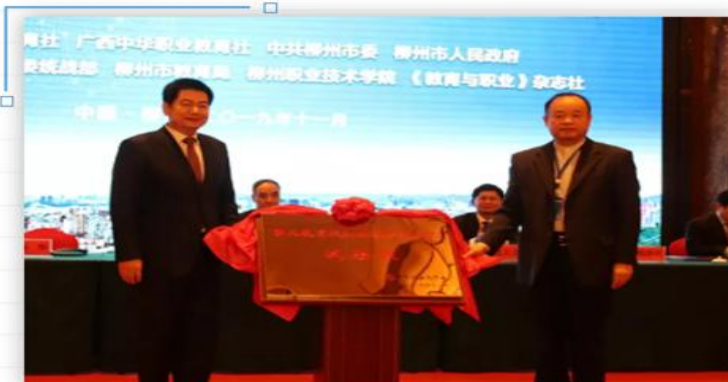
“职业教育促进经济社会发展试验区”揭牌仪式

会上，覃胜阳向中共柳州市委书记、市人大常委会主任郑俊康授“中华职业教育社职业教育促进经济社会发展试验区”铜牌。中华职业教育社副理事长苏华向柳州职业技术学院院长石令明授“中华职业教育社职业教育促进经济社会发展试验区”铜牌。中华职业教育社党组书记、总干事苏乃纯与中共柳州市委副书记、市人民政府市长吴炜共同签署了《中华职业教育社、柳州市人民政府共同推进“职业教育促进经济社会发展试验区”建设协议书》。开幕会由方乃纯主持。